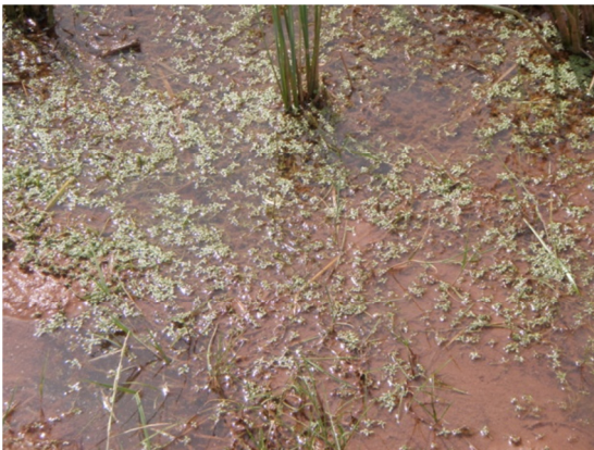
Callitriche sp. junto a Isoetes echinosporum