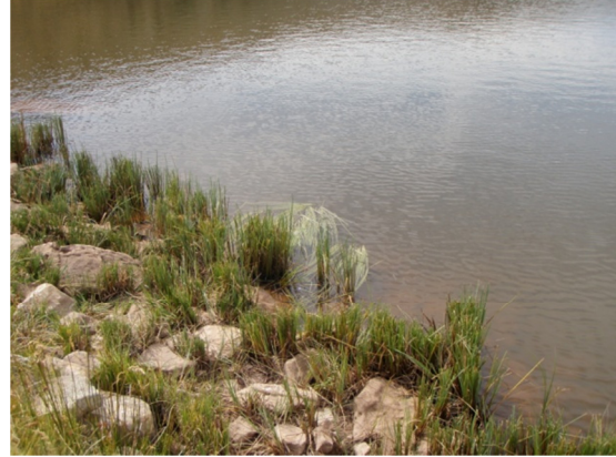
Efectos del pastoreo del ganado sobre la vegetación litoral