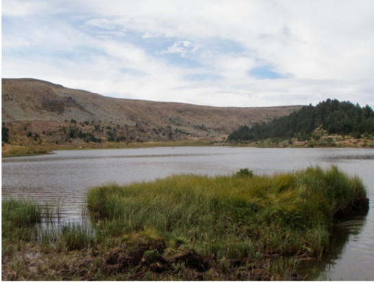
Vista de la laguna