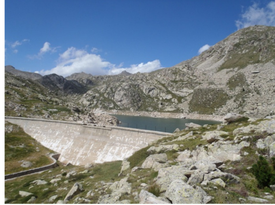
Vista de la presa.