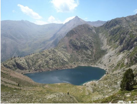
Vista general del lago.