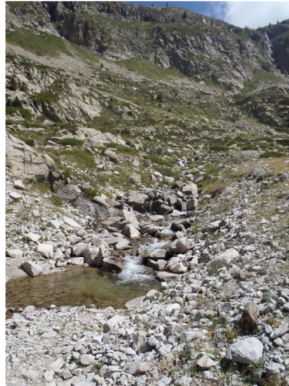
Curso de agua influente al lago.