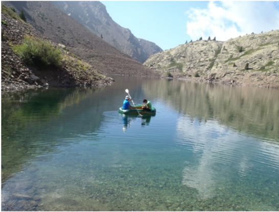
Muestreo en embarcación.