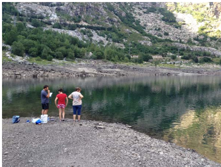
Figura 2. Vista de la zona de muestreo en el embalse