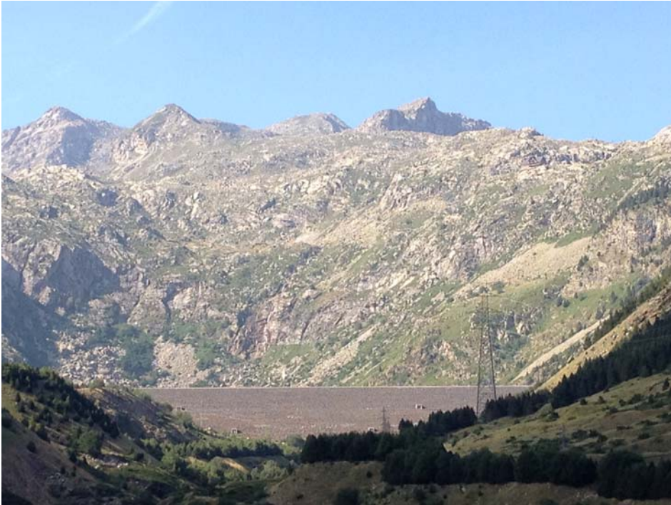
Figura 3. Vista de la presa del embalse