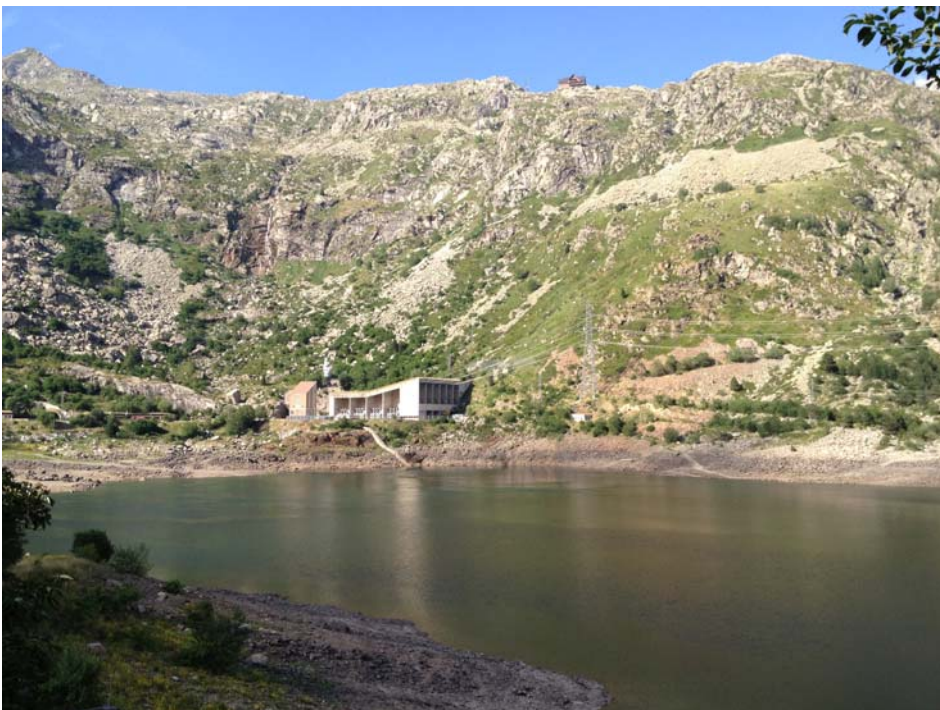
Figura 4. Vista de la cola del embalse y la central hidroeléctrica