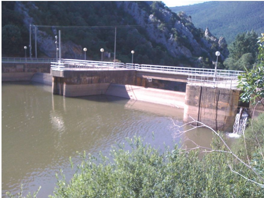
Figura 3: Vista de la presa del embalse