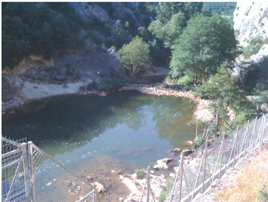
Figura 4: Vista desde la presa hacia aguas abajo